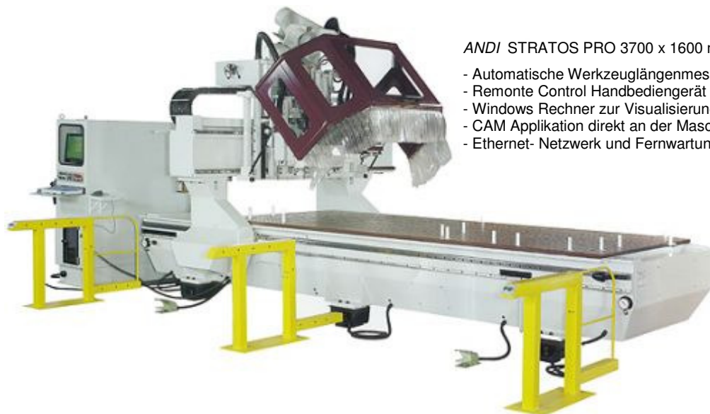
ANDI STRATOS PRO 3700 x 1600 mm mit PC - Bedieneinheit.

Mit wahlweise 3- oder 4-Achsen Simultanbearbeitung ausgerüstete CNC Maschine für Anwendungen in der Kunststoff- und Holzverarbeitung.