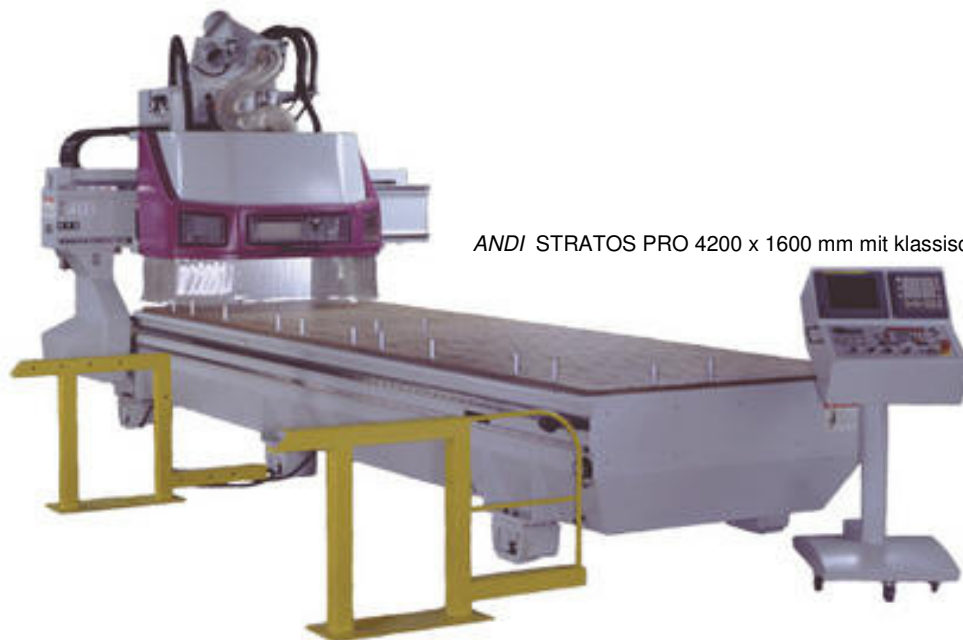
ANDI STRATOS PRO 4200 x 1600 mm mit klassischem Bedienpult

Die CNC-Bearbeitungszentren der Baureihe ANDI STRATOS wurden speziell für Anwender entwickelt, welche eine flexible Anlage für hochwertigste Anwendungen erfordern.